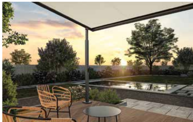
Mit höhenverstellbaren Säulen lässt sich die Pergolamarkise an den Stand der Sonne anpassen.

Pergolamarkisen bieten hier eine interessante Alternative zu den freitragend montierten Gelenkarmmarkisen. Ihre Grundkonstruktion orientiert sich an der klassischen Pergola, die bereits seit der Antike als Sonnenschutz im Übergangsbereich zwischen Haus und Terrasse diente.