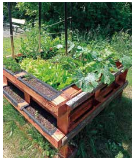
Das Hochbeet ist ein Projekt der „Mauerwerker“.

Abwechslungsreich werden auch die sechs Wochen Sommerferien im Mauerwerk. Es steht die Premiere des Outdoor-Camps vom 10. bis 12. August in Kooperation mit den Jugendhäusern Naunhof und Großpöna an. Wir werden drei Tage in Zelten und Tipis am Albrechtshainer See verbringen und uns verschiedenen Herausforderungen stellen. Es sind viele weitere Highlights geplant: die Umgebung mit dem Fahrrad erkunden, Besuch des Freibads, Turniere, Kreativangebote und der offene Treff für alle Kinder