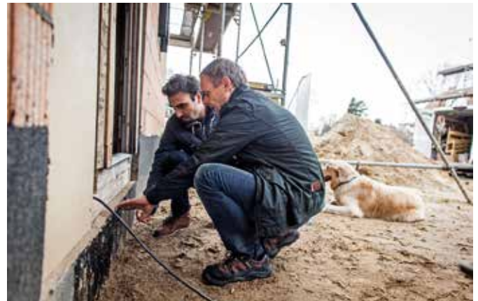
Egal ob man mit Generalunternehmer, Generalübernehmer oder Bauträger baut: Unabhängige Qualitätskontrollen während der Bauphase helfen, Baumängel zu vermeiden.

Bau und Grundstück aus einer Hand gibt es beim Bauträger. Diese Form des Immobilienerwerbs ist interessant für alle, die sich nicht erst auf die Suche nach Bauland machen möchten. Sie sind allerdings keine Bauherren im klassischen Sinne, sondern Käufer von Haus und Grund. Der Bauträger ist zunächst Eigentümer des Baugrundstücks. Mit dem Vertrag verkauft er es zusammen mit der Bauverpflichtung zur Errichtung eines Hauses. Bauträgerverträge müssen unbedingt notariell beurkundet werden.