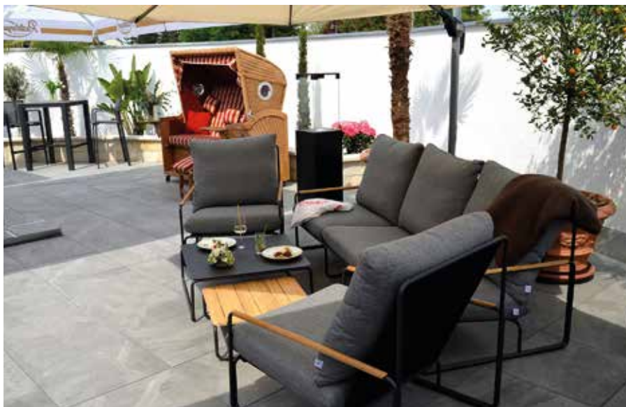
Unser sommerlicher Freisitz lädt zu gemütlichen Stunden ein.

Wir haben unseren langersehnten Freisitz für Sie eröffnet. Damit steht einem geselligen Zusammensein mit Freunden an milden Sommerabenden nichts mehr im Weg. Bei Vogelgezwitscher und gelegentlich toller Livemusik können Sie unser leckeres, saisonales Essen unter freiem Himmel genießen und ganz nebenbei schöne Dinge für Ihr zu Hause erwerben. Denn unser Showhotel-Motto gilt auch für unsere Gartenmöbel. Sie können bei uns unterschiedliche Sitzgruppen, Tische und Stühle ausprobieren. Das bietet viele Vorteile. Während Sie sonst im Einzelhandel einfach anhand der Optik oder des Materials ihre Kaufentscheidung treffen, können Sie die Möbel bei uns live ausprobieren. Sind die hübschen Gartenmöbel auch nach einem langen Abend mit Freunden noch gemütlich? Testen Sie es bei uns aus!