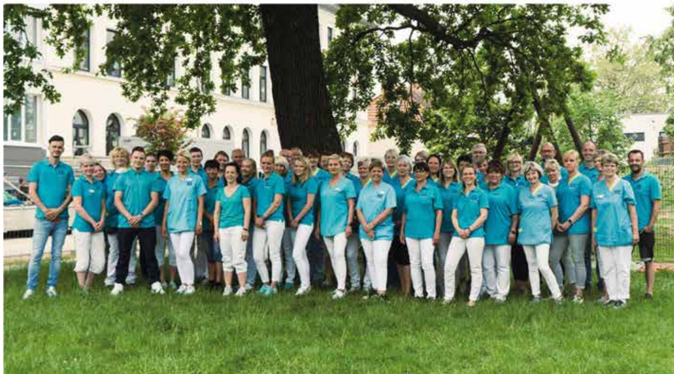
Teamfoto Pflegedienst Holzhäuser