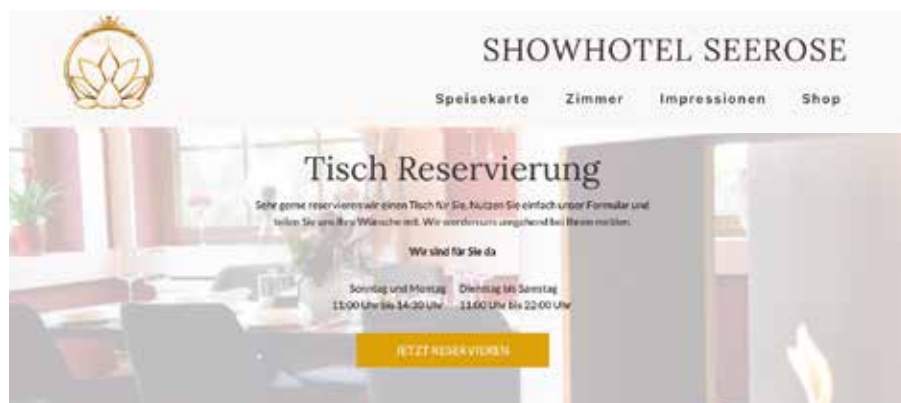
Unsere neue Homepage: www.showhotel-seerose.de .

Hier finden Sie uns: Kiebitzgrund 1, 04824 Beucha www.showhotel-seerose.de