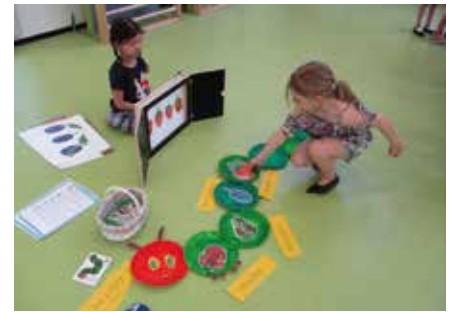
Schmetterlingsprojekt der Schlaufüchse.

Ein großes Dankeschön geht an unsere neuen Elternvertreter, diese wurden bei der