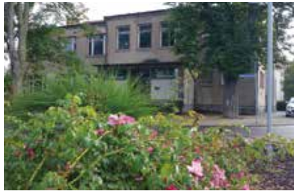
Am Kulturhaus Beucha findet am Samstag, 25. Juni der Tag der Möglichkeiten statt.

Zahlreiche neue Arbeitsplätze werden hier in Zukunft neu entstehen. Dabei soll das Haus für die Bürgerschaft zugänglich bleiben. Denn neben der professionellen Bewirtschaftung sollen hier Räume der Teilhabe, der Bildung, des bürgerschaftlichen Engagements, der Kultur und der experimentellen Betätigung im Makerspace entstehen. Lassen Sie sich vom Kulturhaus und der Vision der zukünftigen vielfältigen Nutzung beim Tag der Möglichkeiten am Samstag, den 25. Juni ab 14 Uhr am Kul-