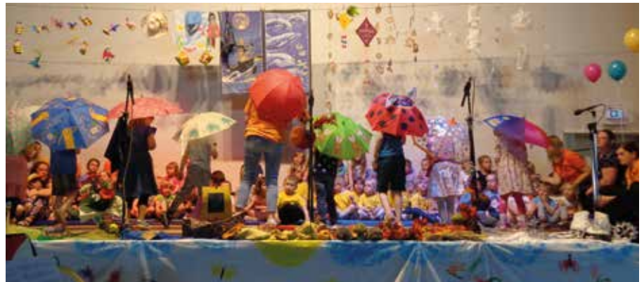
Nach der Aufführung im CVJM-Haus ging das Frühlingsfest im Außenbereich weiter.

Frisch gestärkt probierten die Kinder sich dann auf dem Außengelände an den vielfältigen Spielstationen aus, während die Eltern Gelegenheit hatten, miteinander ins Gespräch zu kommen. Auch war dies eine günstige Gelegenheit, das Projekt neuer „Naturkindergarten“ mit Räuberwald und Nutzgarten zu erkunden, für all jene die bisher noch nicht in den Genuss gekommen waren. Den meisten Eltern ist dieses Projekt bereits bekannt. Sie und einzelne lokale Kleinunternehmen haben dafür im letzten Jahr gespendet und selbst Hand angelegt. Die Bäume wurden im Herbst 2021 gemeinsam gepflanzt, haben nunmehr or-