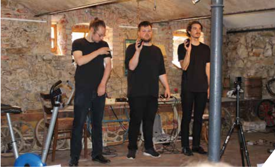
Auftritt des Klangensembles „Atonor“ auf dem Musikalischen Hoffest 2021.