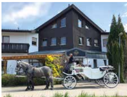
Mit der Pferdekutsche zur Feierlichkeit: das macht jedes Event besonders.

Wenn Sie Ihren Abend langfristig planen wollen, reservieren Sie gerne vorab einen Tisch. Das geht einfach online unter www.showhotel-seerose.de oder Sie schreiben uns an info@showhotel-seerose.de oder rufen uns unter 0170 – 376 9414 an.