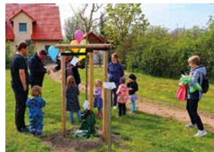
Einer der beiden gespendeten Bäume wächst nun auf dem Spielplatz im Beuchaer Ahornweg.

Wir vom BVB würden uns freuen, wenn Bürger das zum Anlass nehmen, aktiv zu werden. Helfen Sie mit, unsere Umwelt zu schützen. Gestalten Sie unser Leben in unserer Gemeinde mit. Der Bürgerverein Brandis freut sich über Jeden, der seine Ideen